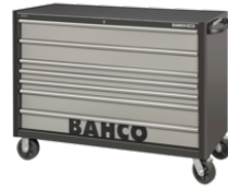
53" XXL Classic C75 værktøjsvogn med 7 skuffer, Sort/Grå, 1016 mm x 501 mm x 1440 mm 1476KXXL7BK