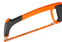
Professionel nedstrygerbue med "Soft grip"-håndtag 300 mm 319