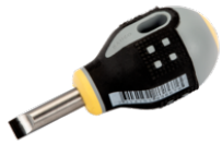
ERGOTM ligekærv skruetrækker med tumlingegreb i gummi 1,2 mm x 6,5 mm x 25 mm BE-8355