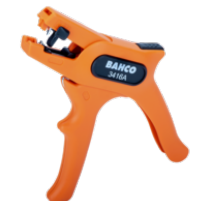
Automatisk afisoleringstang 0,5 mm - 6 mm 3416 A