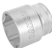
1/2" top, med indvendig sekskant, 20 mm, og højglanspolering 7800SM-20