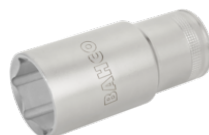
1/2" lang top med indvendig firkant og 32 mm indvendig sekskant 7805SM-32