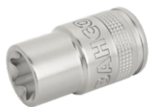
1/2" top med indvendig firkant og E8 TORX® profil 7800TORX-E8