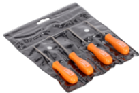
Sæt med miniaturesyle/kroge/optagere 130 mm - 4 dele 2633/S4