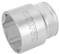
1/2" top, med indvendig sekskant, 32 mm, og højglanspolering 7800SM-32