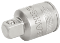
Overgangsstykke "adaptor ned" fra 1/2" indvendig firkant til 3/8" udvendig firkant 8171