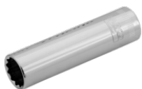
3/8" lang top med indvendig firkant og 8 mm indvendig tolvkant A7402DM-8