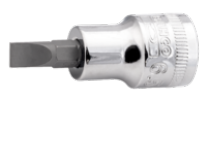
3/8" skruetrækkertop med indvendig firkant til 8 mm ligekærv skrue 7409F-8