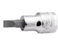
3/8" skruetrækkertop med indvendig firkant til 6,5 mm ligekærv skrue 7409F-6.5