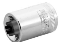
3/8" krafttop med indvendig firkant og E8 TORX® profil 7400TORX-E8