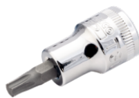
3/8" skruetrækkertop med indvendig firkant til T27 TORX® kærv 7409TORX-T27