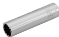
3/8" lang top med indvendig firkant og 9 mm indvendig tolvkant A7402DM-9