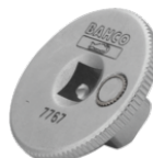
Fladt overgangsstykke "stigende", 1/4" indvendig firkant til 3/8" krafttop 7767