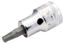
3/8" skruetrækkertop med indvendig firkant til T45 TORX® kærv 7409TORX-T45