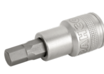
1/2" sekskanttop til 4 mm sekskantskrue 7809M-4