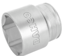
1/2" top, med indvendig sekskant, 13 mm, og højglanspolering 7800SM-13