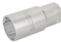
1/2" lang top med indvendig firkant og 13 mm indvendig sekskant 7805SM-13