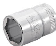
3/8" topnøgle med indvendig firkant med 13 mm indvendig sekskant 7400SM-13