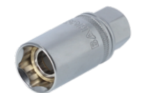
3/8" tænderørstop, 16 mm 7406ZZ-16