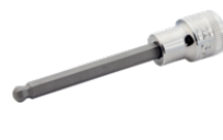
3/8" topskruetrækker med kugle og indvendig firkant til 4 mm sekskantskruer 7409BH-4