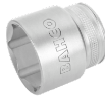
1/2" top, med indvendig sekskant, 28 mm, og højglanspolering 7800SM-28